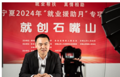
现场直播带岗

就业是民生之本。新的一年，随着2024届高校毕业生数量再创新高，就业总量压力依然存在，但随着经济回升向好，稳就业积极因素将不断显现。求职者如何应对新挑战、把握新机遇？ 记者近日在多家知名企业、高校、网络招聘机构调研采访，感知企业招人用人新趋势，观察就业市场新特点、各方稳就业新动向。