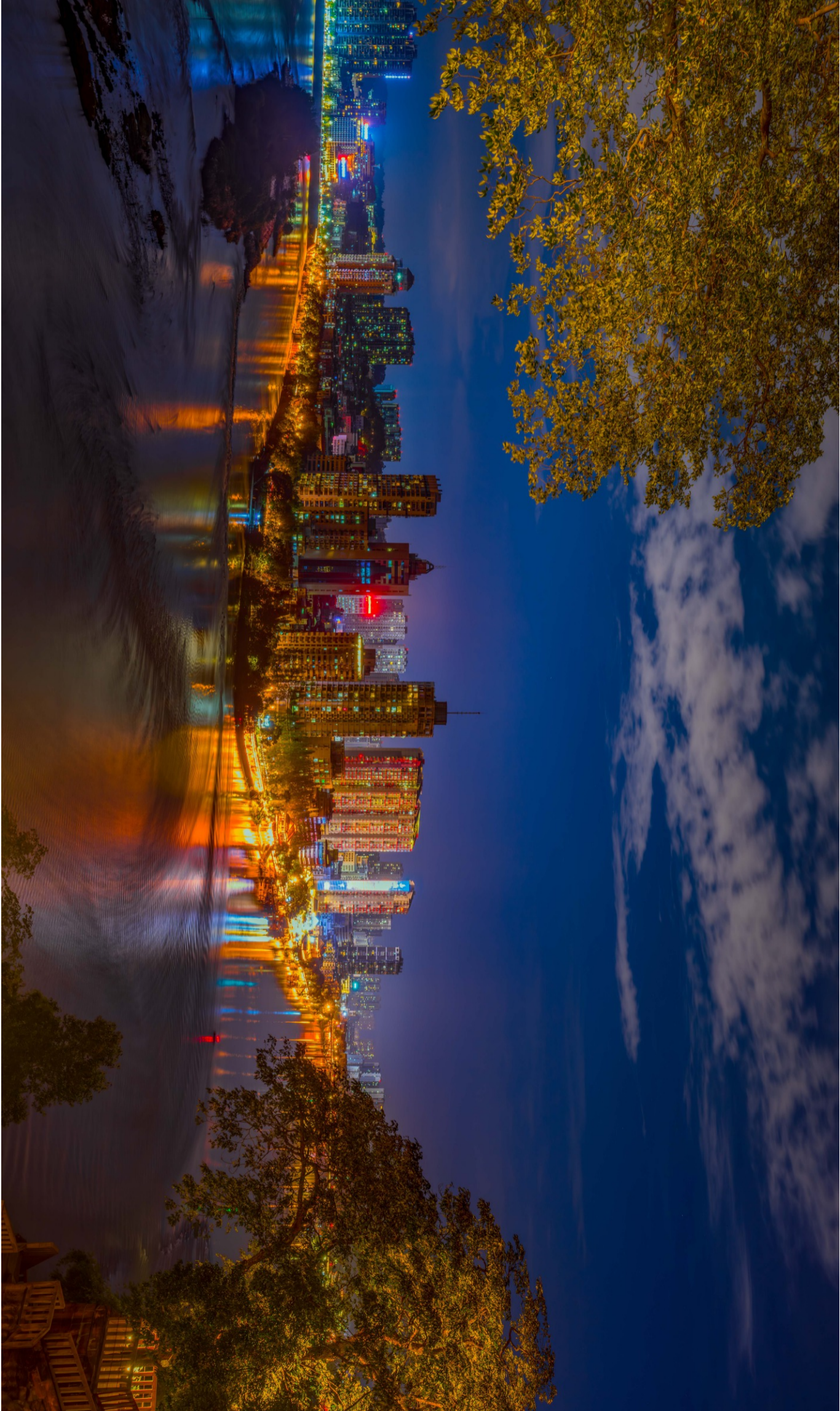
乐山城夜景