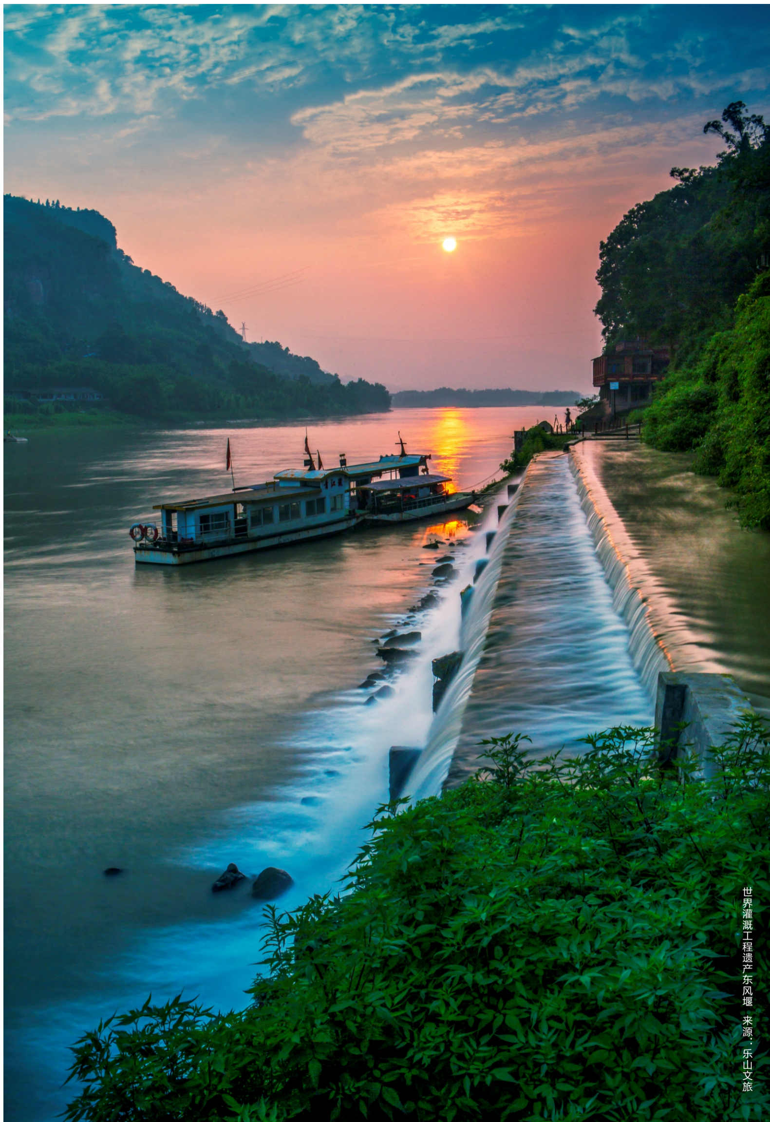
世界灌溉工程遗产东风堰