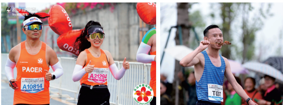
2023乐山半程马拉松赛

奖牌整体像是一块精美怀表，外壳正面为“乐山大佛”半身像、三江之水的化形，并且写有赛事名称字样，外壳背面为“乐山半程马拉松”标志和赛事名称弧形字样。奖牌正面为提炼升级的凤凰+赛道形象，搭配郭沫若书法“乐山”字体，以及“四川乐山”的字样，奖牌背面为“乐山半程马拉松”“中国田径协会”标志，并且写有“21.0975KM”“FINISHER”等字样。奖牌绳子以三种颜色弧线交织组成，并写有“2024乐山半程马拉松暨‘跑遍四川’乐山站”等字样。