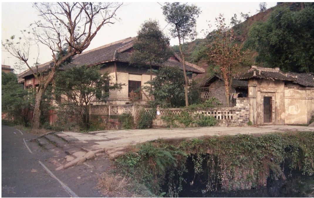
牛华溪剑霜堂（现已不存）