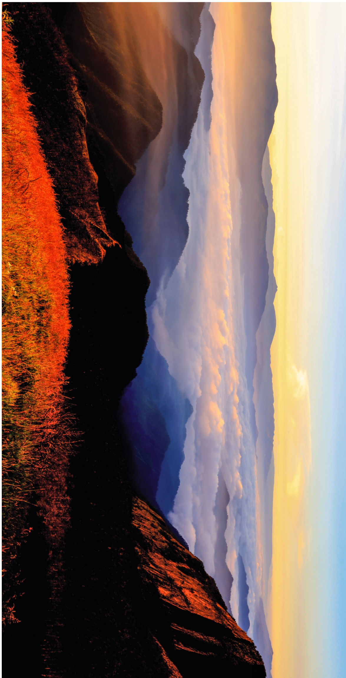
峨边黑竹沟马鞍山