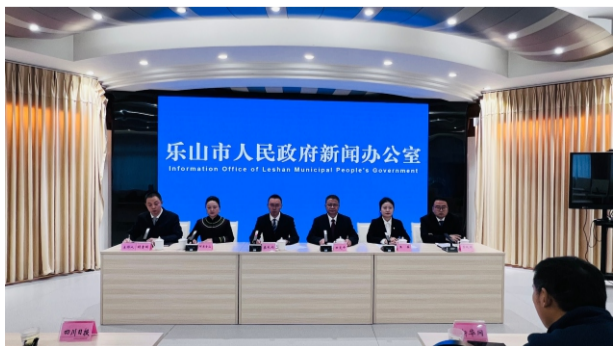
发布会现场

2024年1—9月，全县实现地区生产总值48.2亿元。其中，第一产业增加值9.44亿元，同比增长3.9%；第二产业增加值19.64亿元，同比增长4.1%；第三产业增加值19.16亿元，同比增长5.6%。规模以上工业增加值同比增长0.7%。