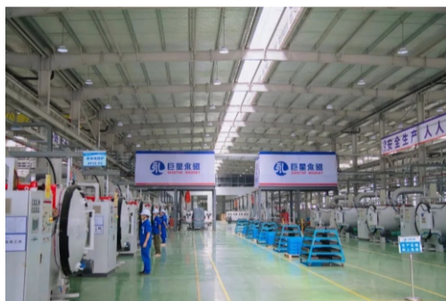
巨星永磁生产车间一线

聚焦川渝协同共建的电子信息、装备制造、汽车、特色消费品等世界级产业集群，以及机器人、智能网联汽车等战略性新兴产业，加快实施宜宾锂电、绵阳巨星永磁、德阳航空航天燃机装备等一批有影响力的产业项目，特色鲜明、安全可靠的区域产业链供应链体系正不断完善，川渝产业集群能级和核心竞争力将进一步提高。