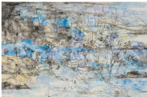
《最后一场雨悄悄来临》