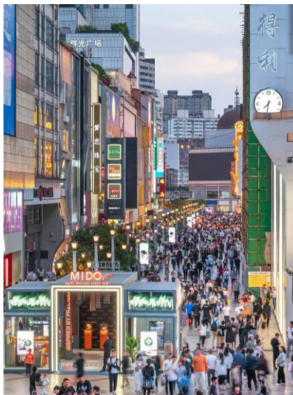
成都春熙路商业街

建成投用锦屏深地实验室等重大科技基础设施项目，加快推进成渝综合性科学中心、西部科学城等重大创新平台建设，开工建设中国地震科学实验场等大科学装置等项目，成渝地区正加快成为国家重要的科技创新策源地。