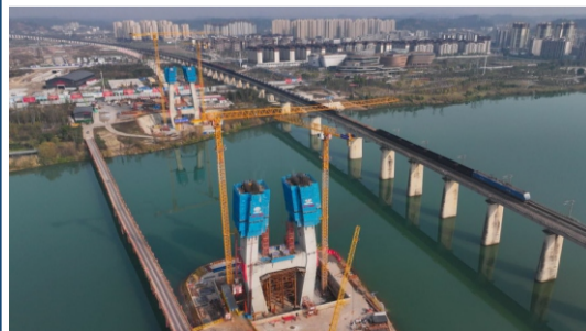
成达万高铁遂宁涪江特大桥建设现场